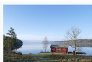
Utsikt från Gyltungebyn