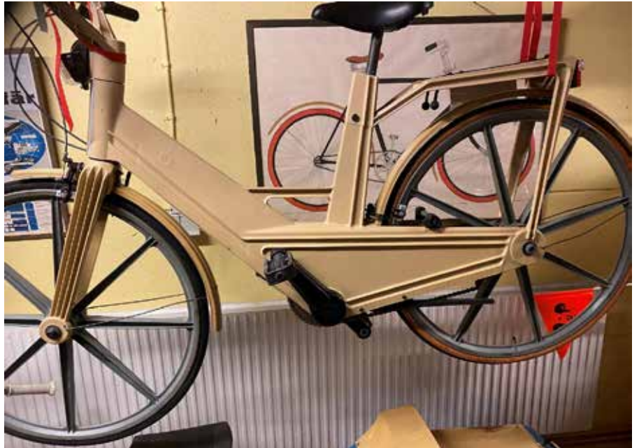
Itera-cykeln, även om den producerades i Vilhelmina ska den så klart ha en plats i Varberg, Sveriges cykel-centrum.

Föreningen Varbergs museum bjöd in till visning av Hallands Kulturhistoriska museums depå i Varberg. Ett 20-tal intresserade trängdes på dagens andra visning. Mycket intressant att dels se alla fina föremål (eftersom de är c:a 150000, så blev det så klart bara en liten del vi fick se). Men minst lika intressant att höra hur man hanterar föremålen. Sedan ett år pågår flytt av textilsamlingen från Varbergs Fästning till kontrollerad miljö i depån. Om jag minns rätt c:a 8000 föremål, alla paketeras individuellt, fryses i en vecka, tas fram, fotograferas, indexeras och läggs i ett förvar med rätt miljö. Ett jättejobb. Några saker som jag fastnade för: