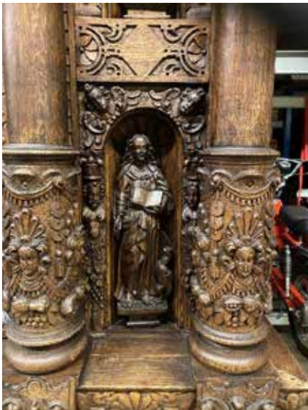
En fantastisk detalj från ett nyinkommet skåp från Lindberg kyrka

Så passa på när ditt lokala museum bjuder in, man går inte missnöjd hem!