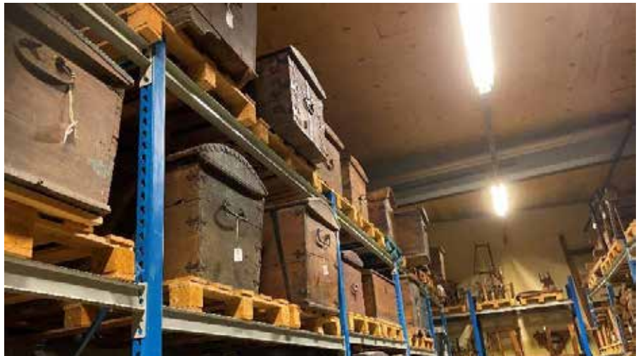
Mängder av kistor