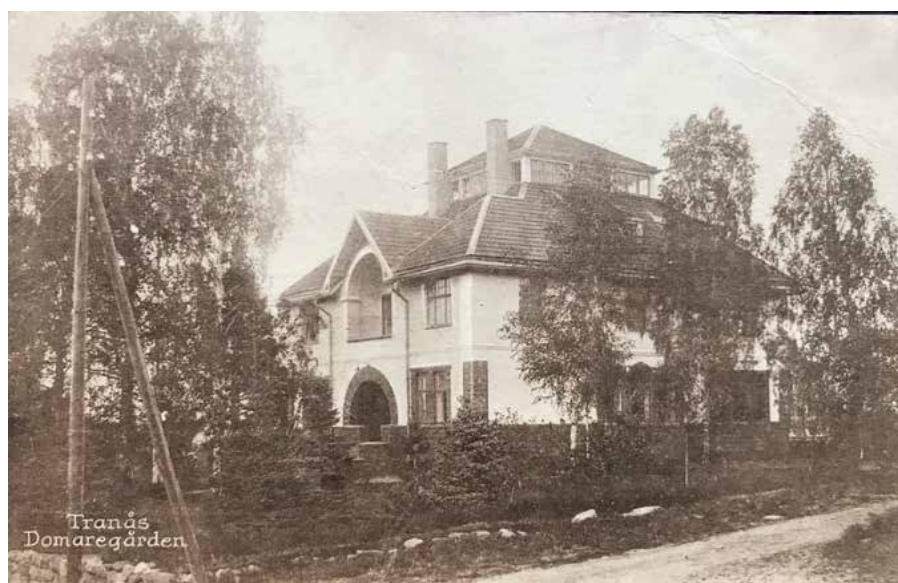
Del 1 Romanäs sanatorium i Tranås, bodde på Domaregården i Tranås

9/9 14-årsdagen i yrket, Reste från Engelholm 5.52, Reste från Åstorp