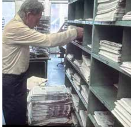
Dags att sortera posten. (forton från föredraget)