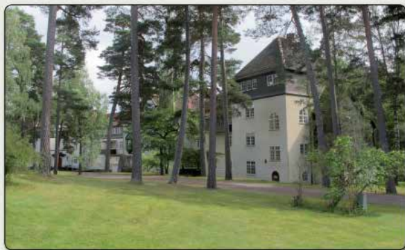
Den omgivande tallskogen ansågs vara välgörande för de lungsjuka patienterna.

Till sanatoriet kom i första hand många välbeställda patienter. En av dem var författarinnan Harriet Löwenhjelm, som också slutade sina dagar på Romanäs 1918. Sedan sanatorieverksamheten upphörde år 1950 har Romanäs använts som bland annat vårdhem och behandlingshem.