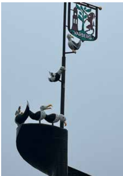
Härlig dekoration nere vid hamnen