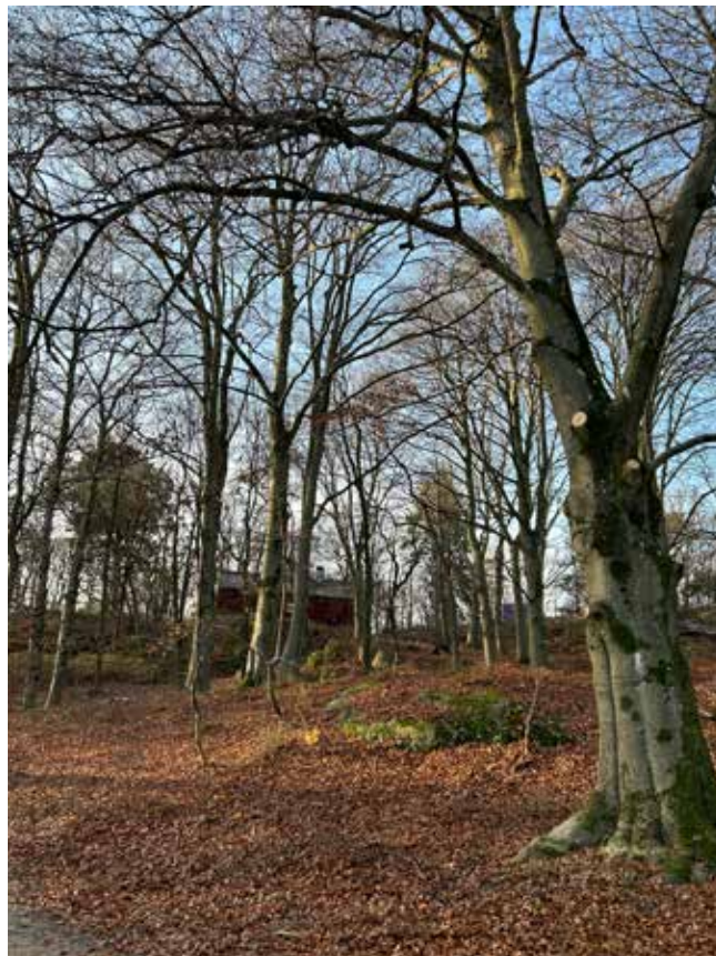
Slottsskogen i november