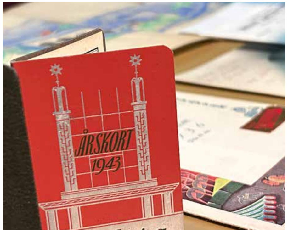
Lite smått och gott ifrån Lisebergs samlingar