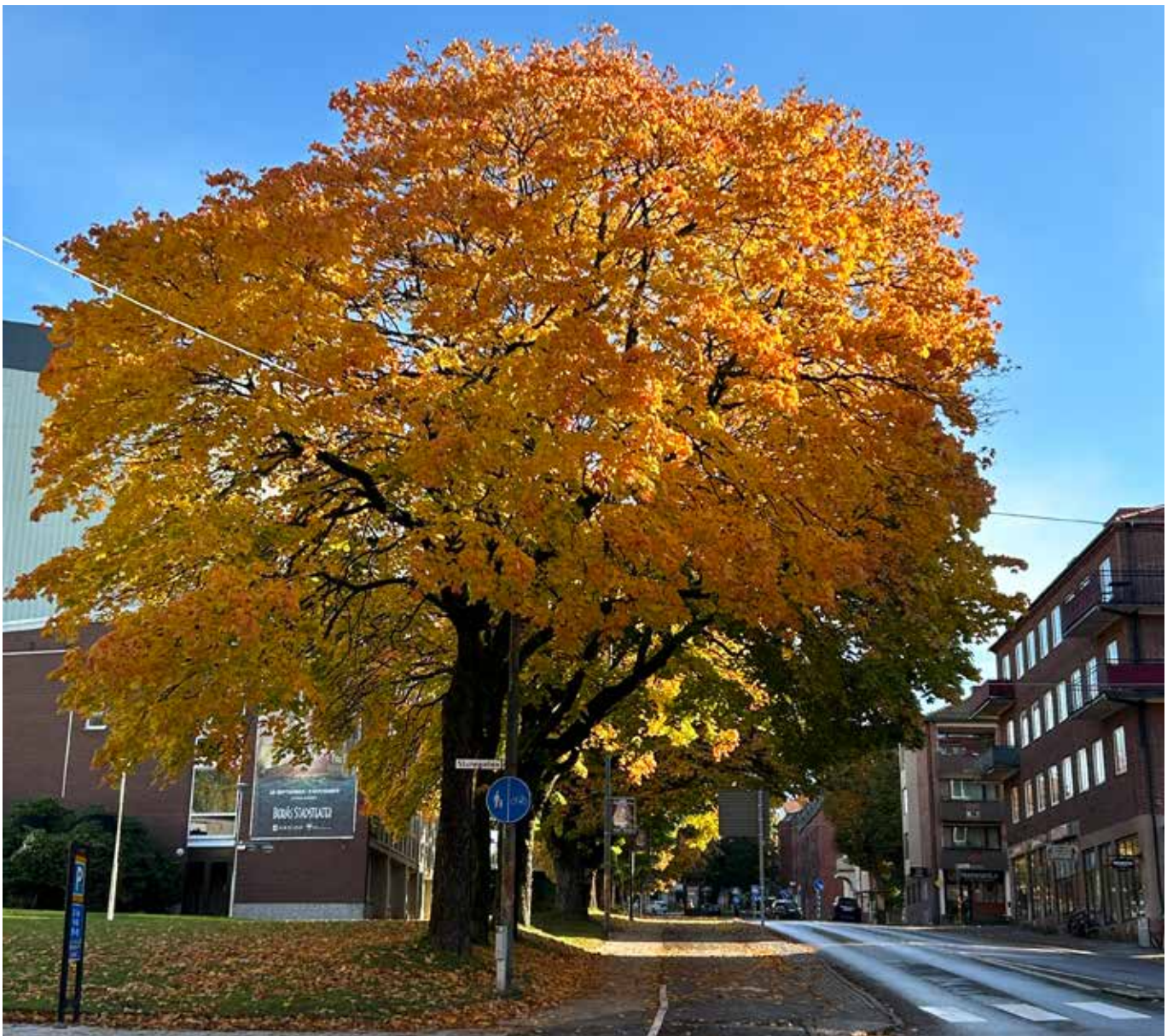
Bildtext, Borås i höstskrud, foto Christina Claeson