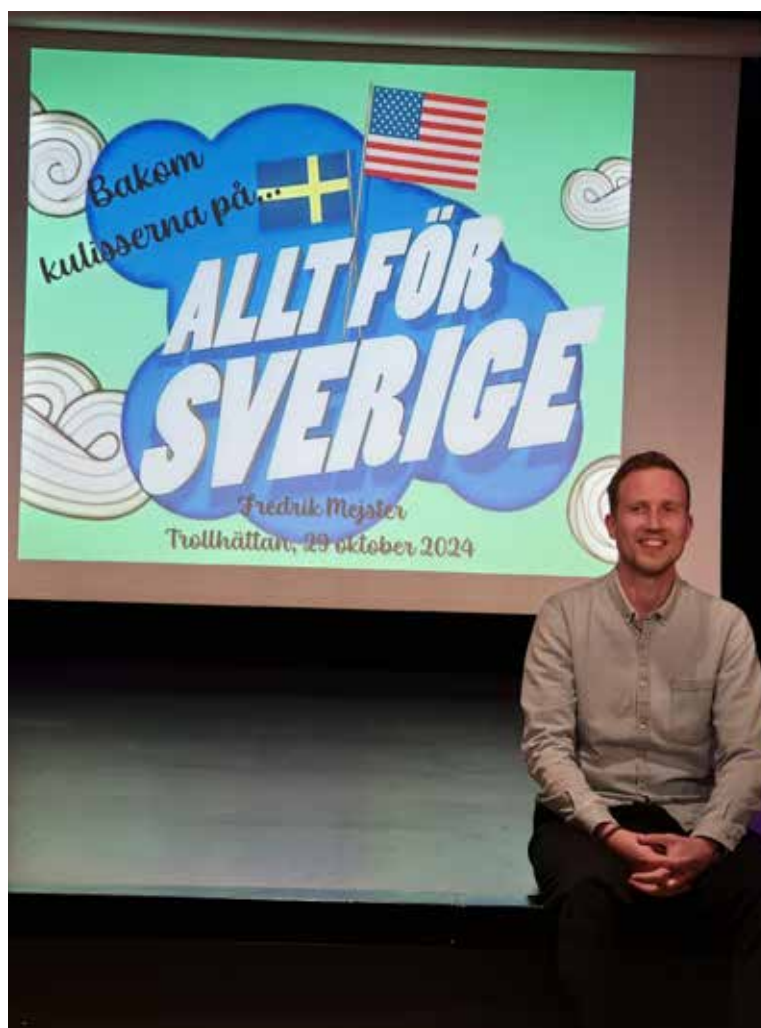
Bra PR för den kommande programserien