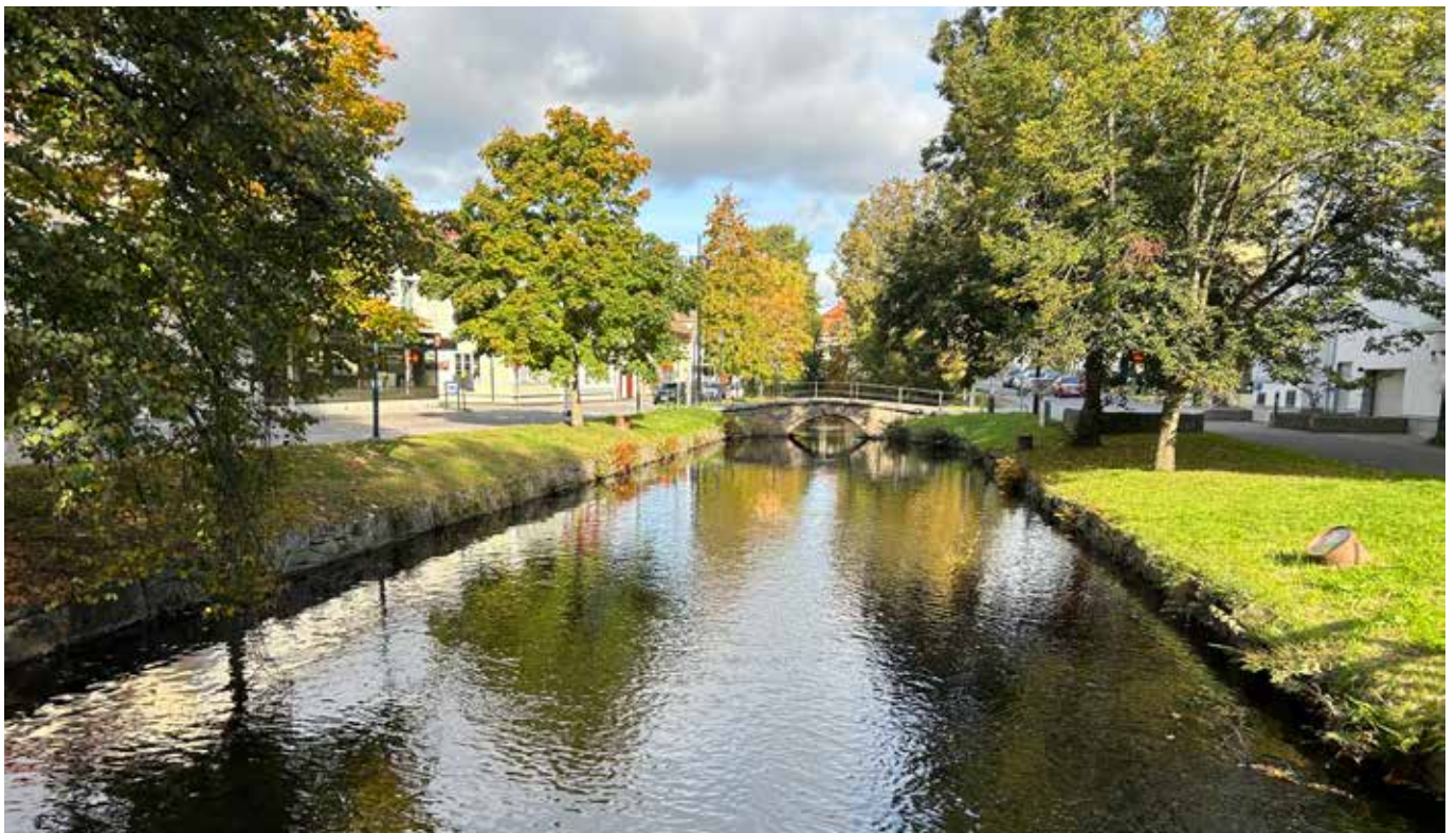
Solen glittrar i Nyån som slingrar sig fram