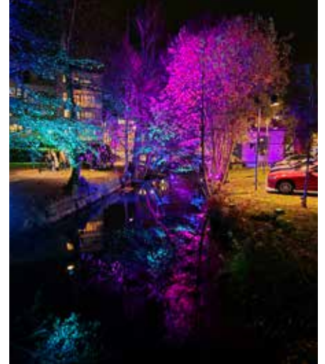
Kvällsbelysningen är helt magisk

En liten promenad i närheten hanns det också med, belysningen tändes