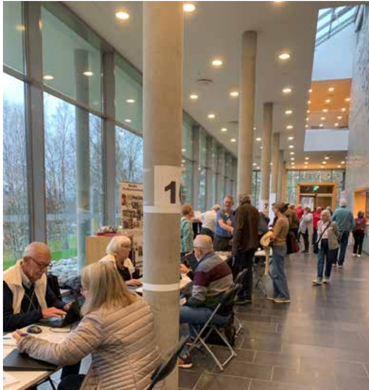
Strid ström av besökare till utställarna, foto Einar Gustafsson