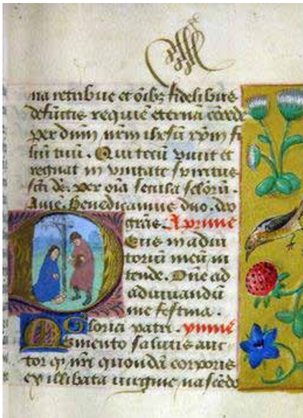
Bild 1. KB. Illuminated manuscripts in Swedish collections, A 233.