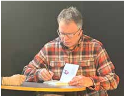
Många var det som ville ha en signerat exemplar av "Alla är vi valloner"

Trots att jag har hört från en släkting på min fars sida att "vi är säkert valloner, vi har så lätt att bli bruna, och har mörkt hår", så vimlar inte släkträdet av de hantverksyrken som förknippas med valloner, däremot är det gott om rusthållare, gästgivare, samt en och annan militär från en kvist på släkträdet. Så att passa på och lära sig lite mer kom väl till pass.