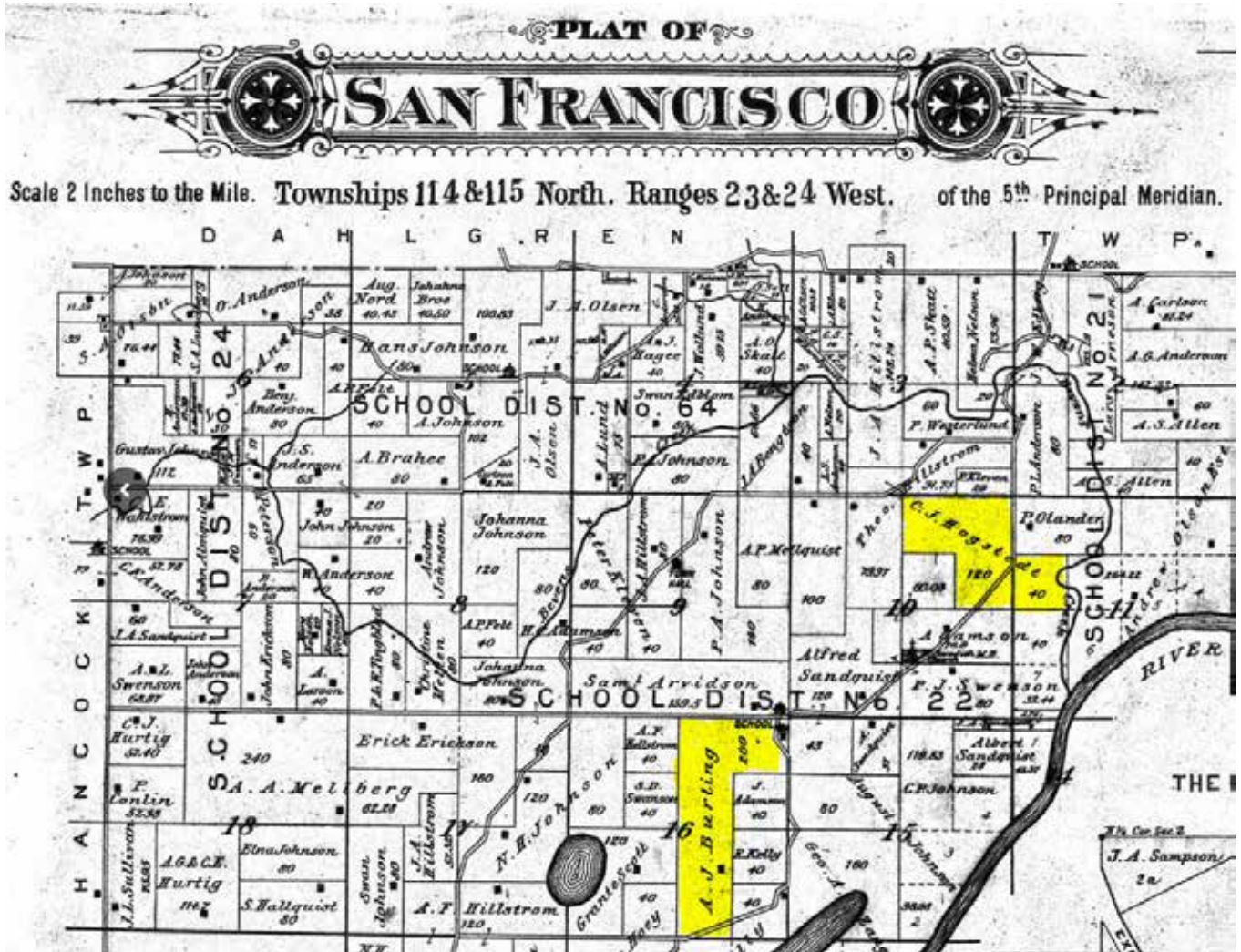
Plat of San Fransisco