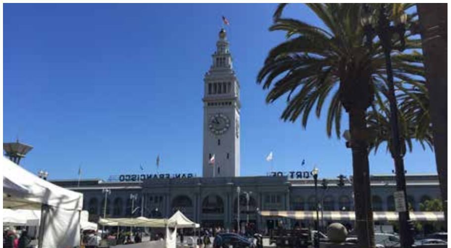
Nutida bild från San Fransisco

Som avslut på information om San Fransisco, en sommarbild från 2016