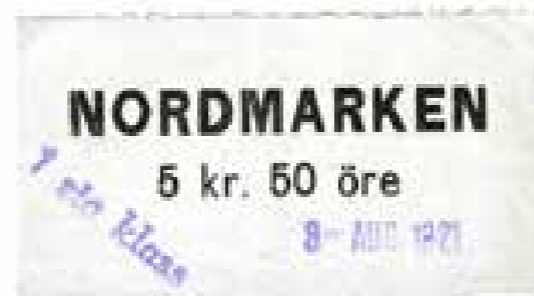
Biljett från Ångaren NORDMARKEN till första klass. Målerad 8/8 1921.

Mer om ångbåtsexpeditioner finns i den fullständiga artikeln på http://www.hembygdsfilateli.se/