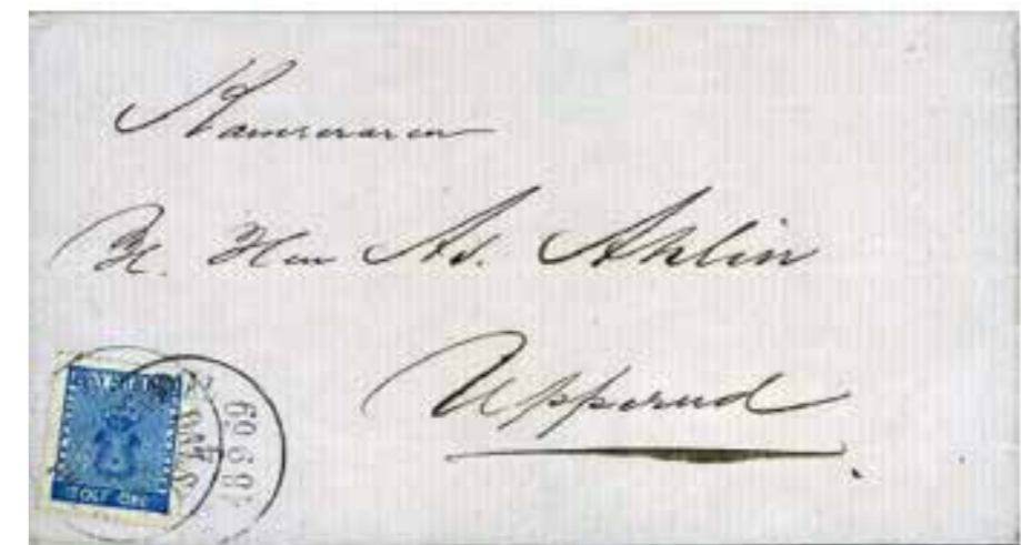
DALSLANDS KANAL 4/9 1869.