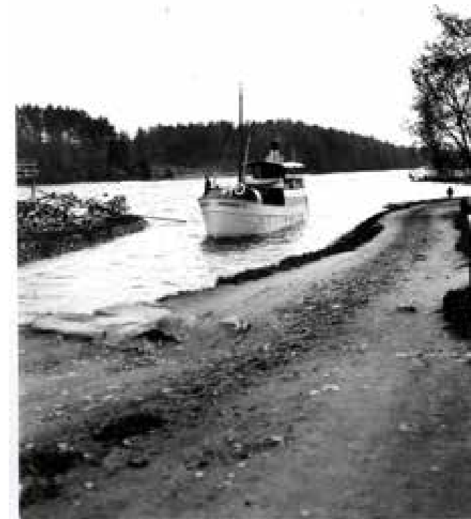
Ångfartyget NORDMARKEN på ingång till slussen i Gustafsfors från sjön Lelängen den 2/6 1916.