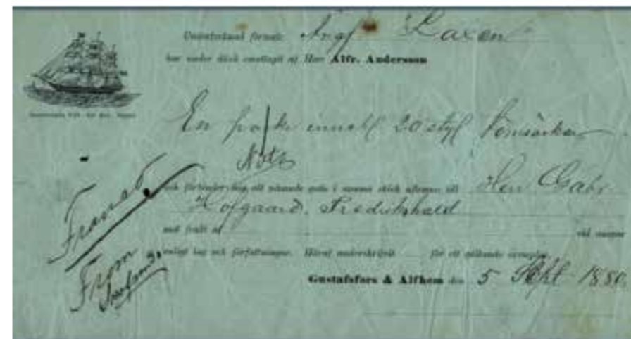
Fraktsedel från Ångfartyget Laxen.

Laxen är den mest omskrivna av alla ångbåtar som innehaft ångbåtspostexpeditioner. Mycket därför att det var den första ångbåten i Sverige att ha postexpedition ombord,