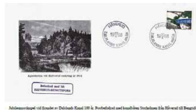
Ångfartyget till Hälvö och Hälvö-Bingsfors vid Strömdet vid Dalslands Kanal 100 år. Postbefordrad med konstlöst Stekblom till Hälvö och Hälvö-Bingsfors.

Måndag 8/5 Göteborg – Strand Torsdag 11/5 Strand – Göteborg Måndag 15/5 Göteborg – Strand Torsdag 18/5 Strand – Göteborg Måndag 22/5 Göteborg – Strand Torsdag 25/5 Strand – Göteborg