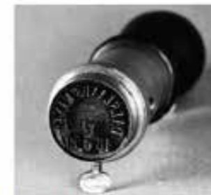
Stampen DALSLANDS KANAL, här med datomet 12/6 1870, samt avtryck av densamma. Finns på Postmuseum i Stockholm.